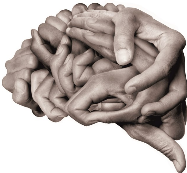
Abb. 3: Brain made of human hands

Nun können wir uns der Fragestellung widmen, ob Motivation und Kultur etwas miteinander zu tun haben, und wenn ja, wo das besonders sichtbar wird.