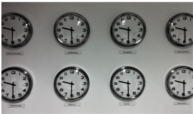
Abb. 2: Zeitzonen

Pünktlichkeit ist der Begriff, der vielen zuerst einfällt und vielleicht noch durch Sauberkeit und Sicherheit ergänzt wird. Sollte unsere Kultur etwa hauptsächlich aus Pünktlichkeit bestehen? Und wenn ja, warum ist ausgerechnet dieses Merkmal so wichtig? Und warum wäre es bedrohlich, wenn uns die Pünktlichkeit abhandenkäme? Ein bisschen Entspannung diesbezüglich wäre ja vielleicht auch ganz gut in Zeiten, in denen die Zahl stressbedingter Erkrankungen kontinuierlich steigt.